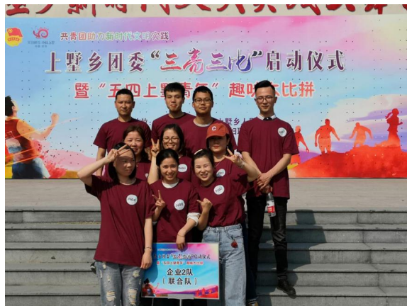
企业文化宣贯（示例）