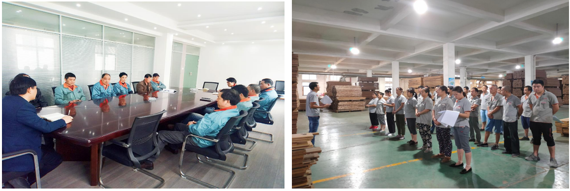
图 3.2-1 各类培训活动

公司每年针对实际和市场形势，识别各部门的培训需求，制定员工培训规划和年度计划，开展职工教育培训，包括质量意识、质量知识、管理制度、专业知识等培训内容。公司每年制定并下发了《年度培训计划》等，对质量诚信教育进行了安排布置。