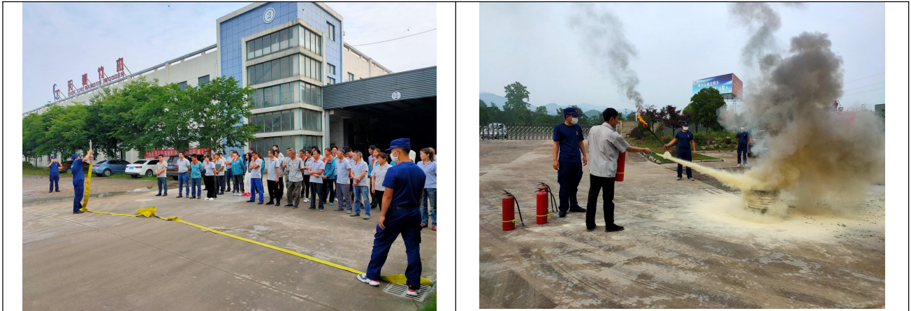
图 6.3-01 2020 年应急演练记录

应急处置时间，暴露存在的问题，以便进一步完善应急预案和配备应急所需的设备器材。公司每年都会各类应急预案进行每年举行火灾消防、管道泄漏等各种应急预案的演练，演练后我们都会安排《应急演练评价》，总结演练，提出改进建议，不断地完善应急预案，更好地预防事故发生后应急措施的落实和有效性。